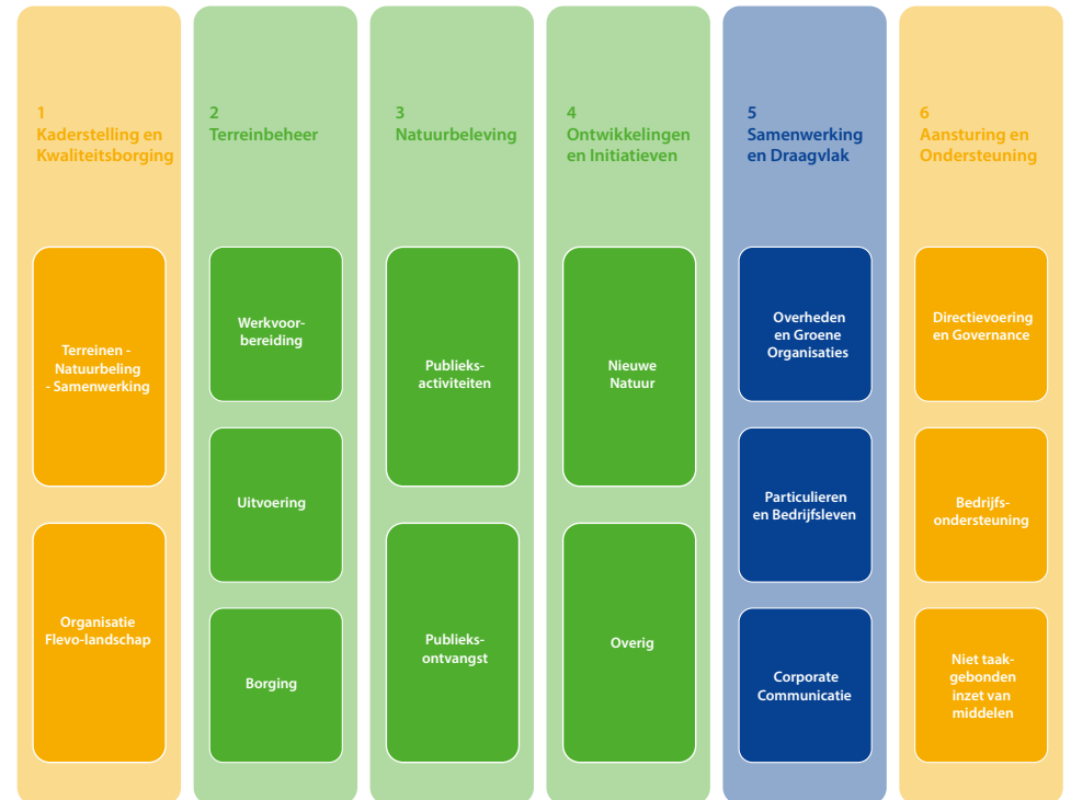
Schema: Hoofd- en deeltaken werkzaamheden Het Flevo-landschap.

We hebben ons werk verdeeld in zes hoofdtaken, zoals aangegeven in onderstaand schema. De kern wordt gevormd door het Terreinbeheer en - het faciliteren van - Natuurbeleving . Hiervoor wordt ook het leeuwendeel van de middelen en inzet aangewend. Daar voegen we ook nieuwe zaken aan toe; Ontwikkelingen en Initiatieven . Het Flevo-landschap staat midden in de maatschappij en werkt heel bewust aan Samenwerking en Draagvlak . Voor al deze werkzaamheden weten we heel precies waarom we wat willen en moeten en hoe we ons werk doen ( Kaderstelling ) en wat we bereiken ( Kwaliteitsborging ). Om dit te kunnen realiseren is adequate Aansturing en Ondersteuning noodzakelijk. De samenhang tussen taken en beleidsdoelen is in de tabel aangegeven.