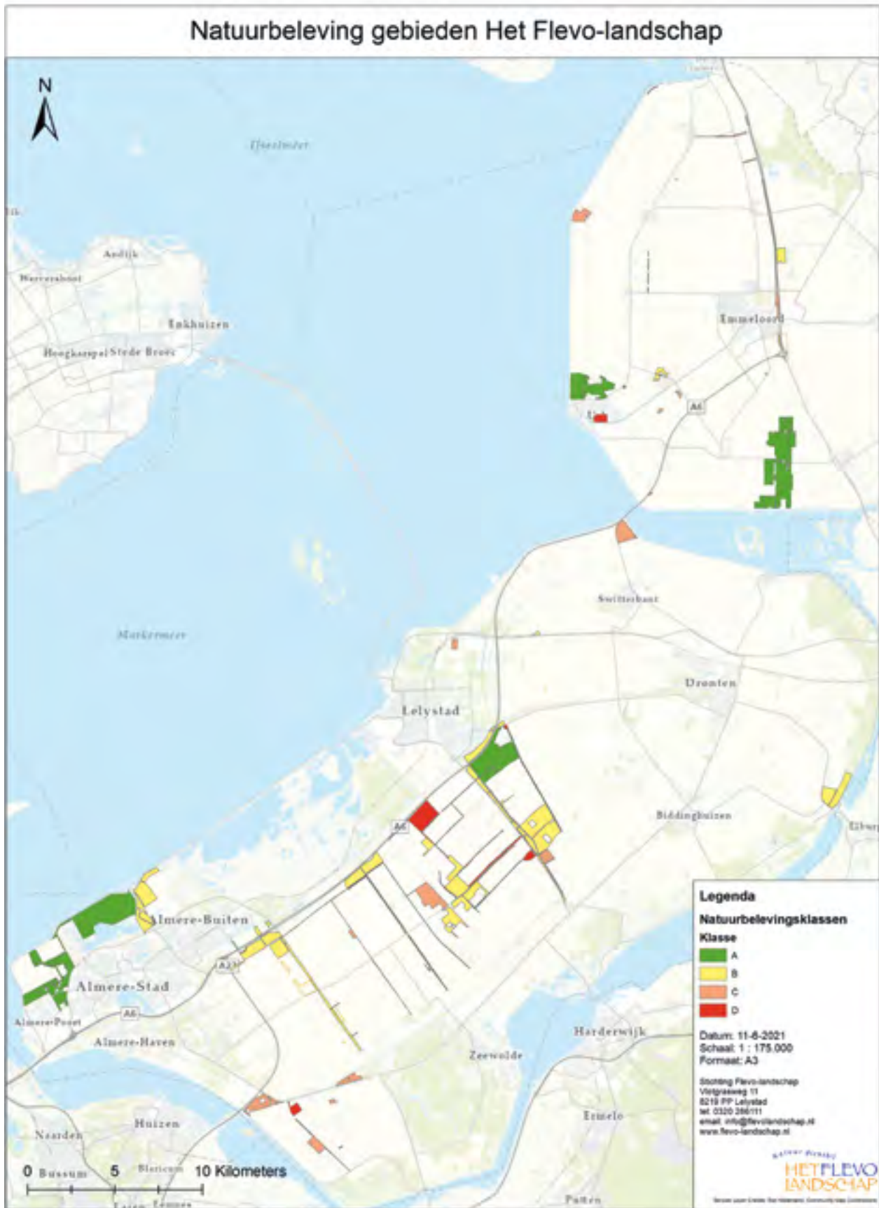
Figuur 2: Planeenheden en natuurbelevings categorieën.